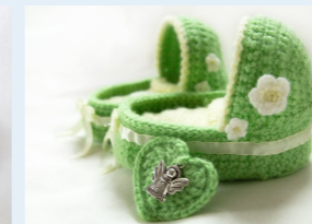
Für die Eltern fertigen wir wichtige Erinnerungsstücke.