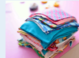
Farbenfrohe Werke bringen Freude in den Alltag.

Darüber hinaus unterstützen wir die Eltern von Sternchen und Frühchen und bieten die Möglichkeit des Austauschs mit anderen Betroffenen. Hierzu haben wir eine eigene Facebookgruppe für sie eingerichtet. Außerdem finden regelmäßig lokale Treffen statt, wo auch Erfolgsgeschichten wie die der Zwillinge Anton und Juri gefeiert werden.