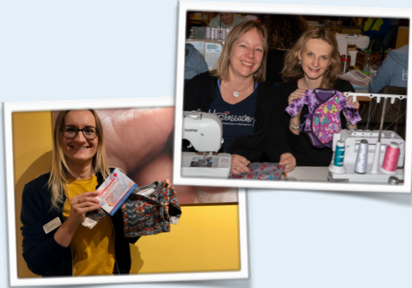
Herzessachen: Mit viel Liebe hergestellt und von Herzen gespendet

Was im Juni 2015 als kleines Projekt in Wandlitz (bei Berlin) begann, hat sich innerhalb kurzer Zeit zu einem anerkannten und gemeinnützig eingetragenen Verein entwickelt.