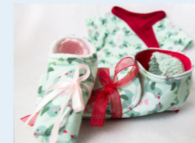
Stilvoll Abschied nehmen, für uns selbstverständlich.